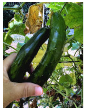
土地の方にキュウリを 戴きました