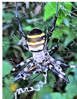
食事中的コガネグモ …ムシャ・ムシャ