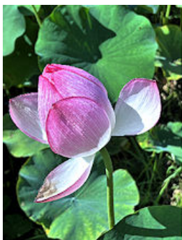
ハスが咲いてきました

上手に鳴くウグイスの声、シャーシャーと鳴くセミそしてカナカナの声。カナカナの鳴き声は大きく次第にか細く波があり、真夏の昼なのにさみしく感じます。