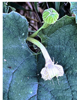
朝には枯れる ラスウリの花