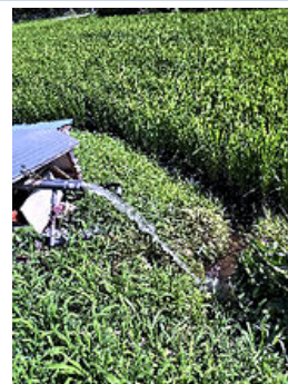
ポンプの水は、深呼吸 するように流れる