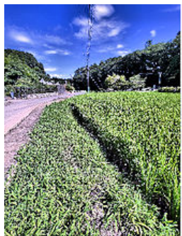
サンサンと降り注ぐ 太陽の恵み