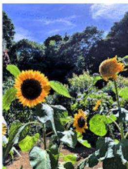
境内ではたくさんの夏の花が咲いて イチヨウの木も青々と茂っています