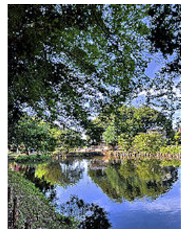
水に映る水神様が 涼しげでありがたい