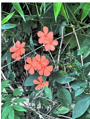
今年も咲いてくれた