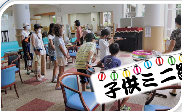
◎ 8月11日、急ぎょ開催した「小学生以下の子供ミニ縁日」。1週間前の告知にもかかわらず大勢の子供たちが参加してくれました。