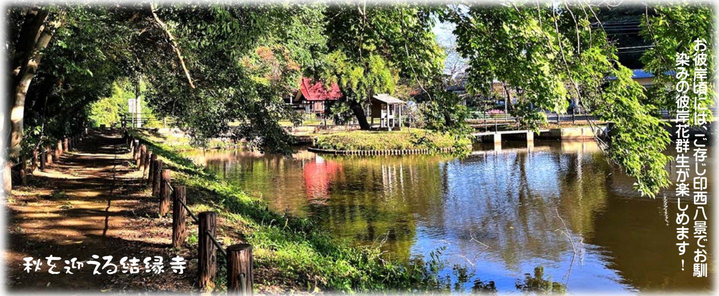
秋を迎える結縁寺