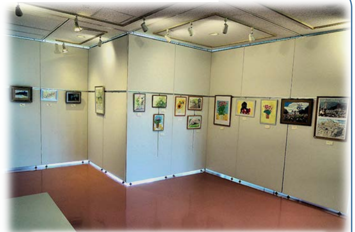
図エクラブ・いにわの (6/27～7/11)