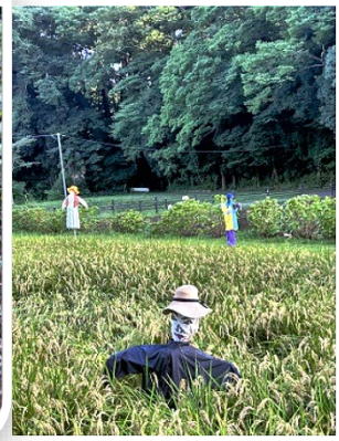
稲を守っているカカシ達