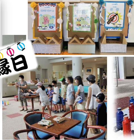
開催を呼びかけるミニ看板群