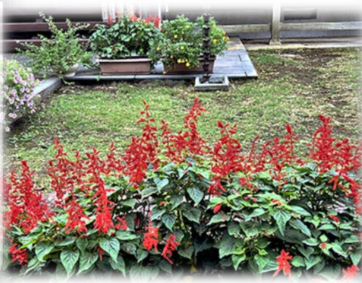
結縁寺は夏の花でいっぱい