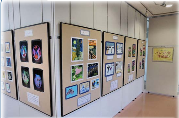
子供のアトリエ パレット会 (6/13～6/26)