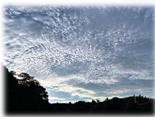
空一面のひつじ雲