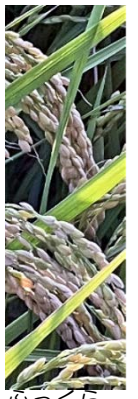
ふっくら実った稲穂