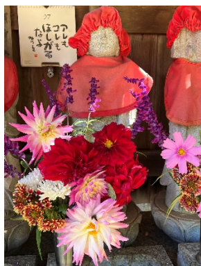
花に埋もれて六地藏