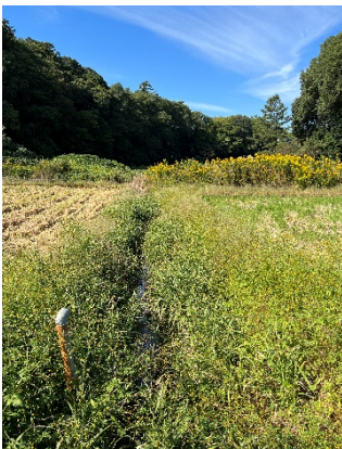
どこも黄色く枯れている