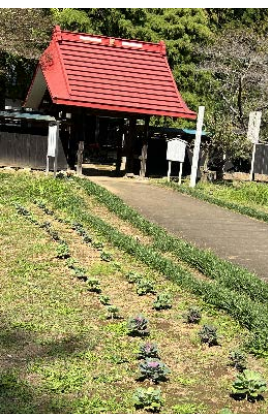
葉牡丹を植えて正月準備