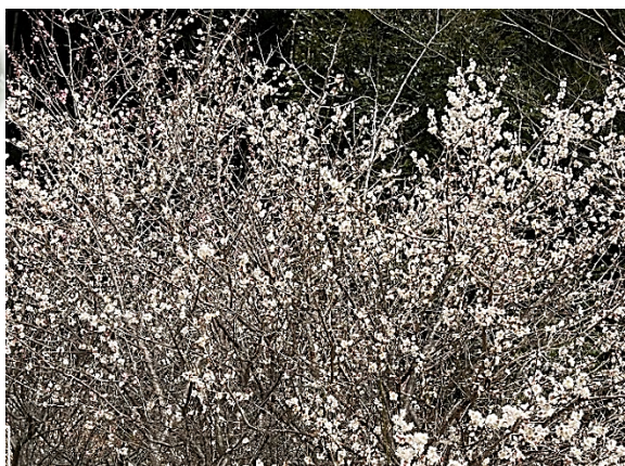
天神様の梅園は次々に咲いていきそう