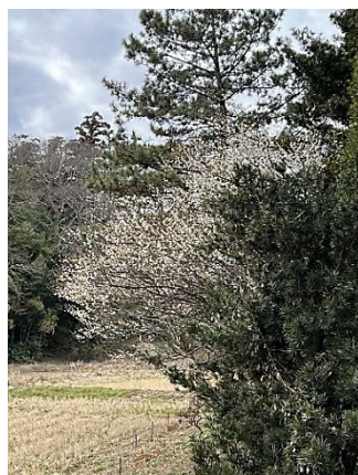
ここでも梅が咲いている