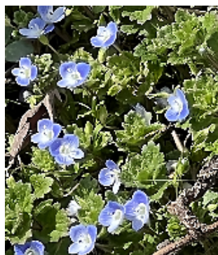
一面のイヌフグリ