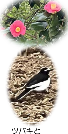
ツバキと セグロセキレイ