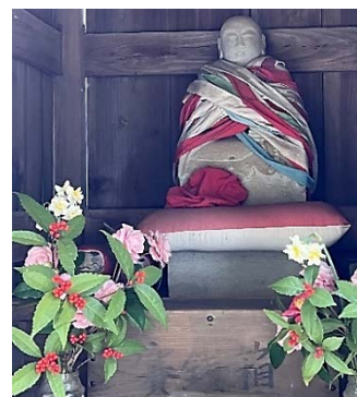
お大師様も花いっぱい