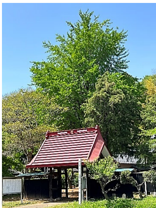
イチヨウの葉も青々と