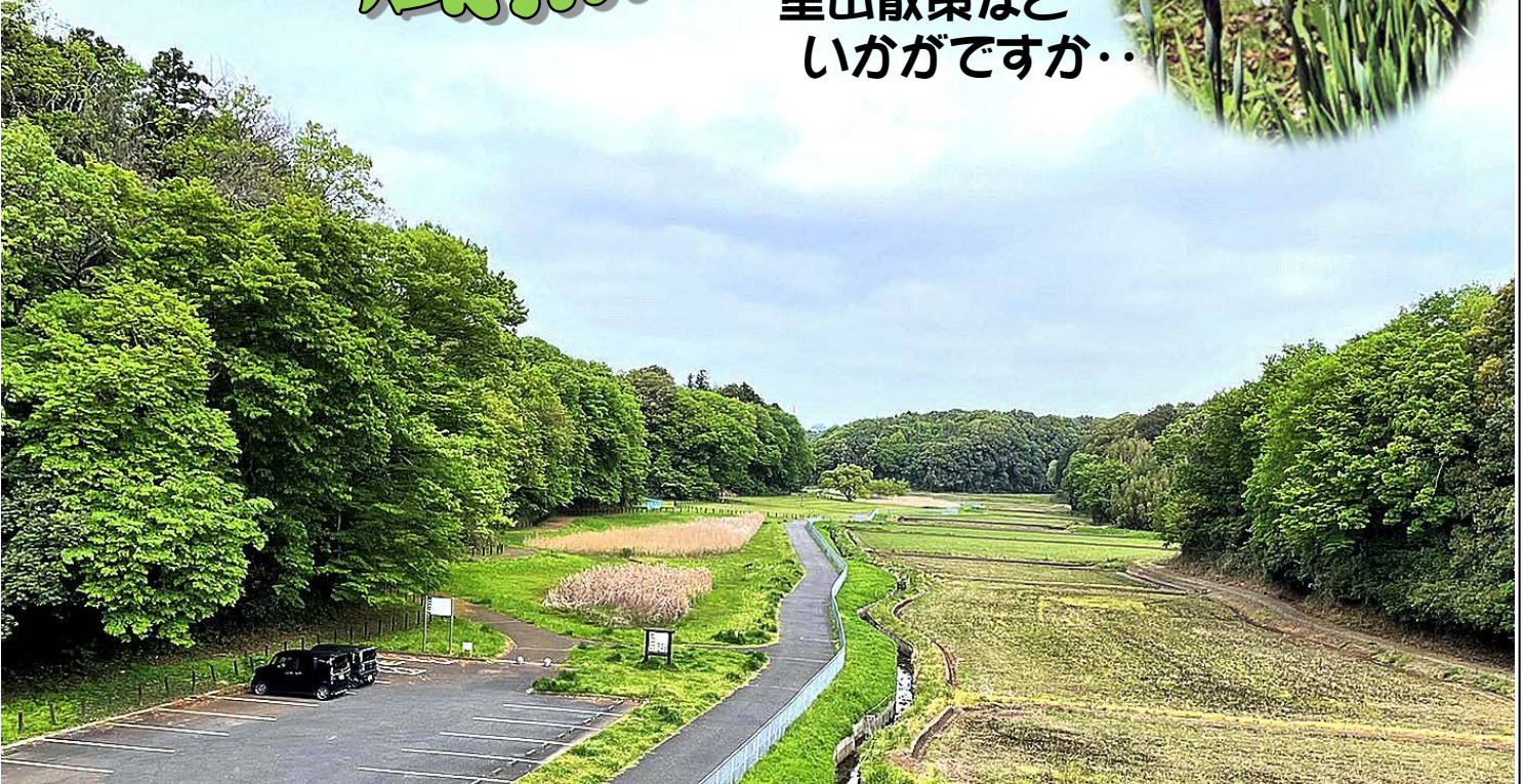
新緑に囲まれた谷津。(松崎公園から結縁寺方面を望む)