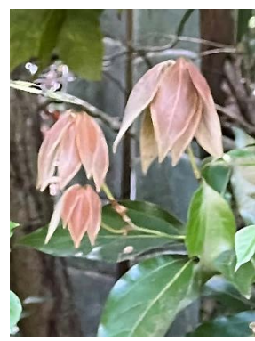
シロダモの若葉は赤い