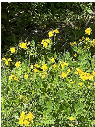
栗の裏手に繁るクサノオウ