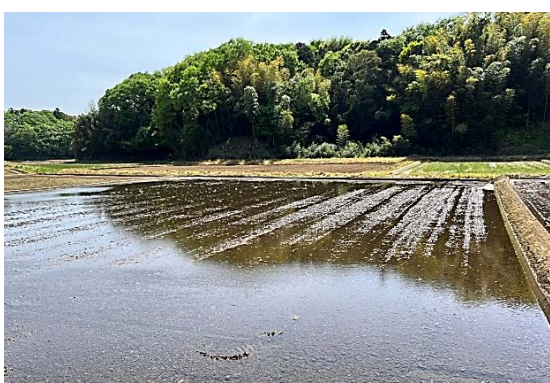
畦を整え、水を張り終え田植えの準備