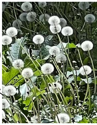
水神様の島タンポポ