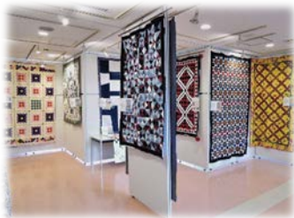
コロネード和の会 (3/6~3/14)