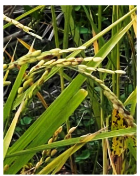
ひこばえも育っている