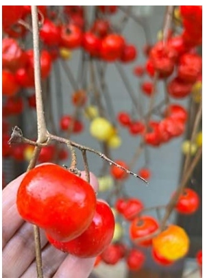
干しているこの実は何?