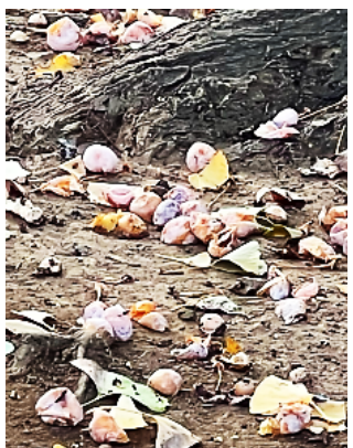
境内いっぱいの銀杏の実

何か知っている匂いがする?と思ったらギンナンでした。結縁寺のギンナンは大きいともっぱらの評判。