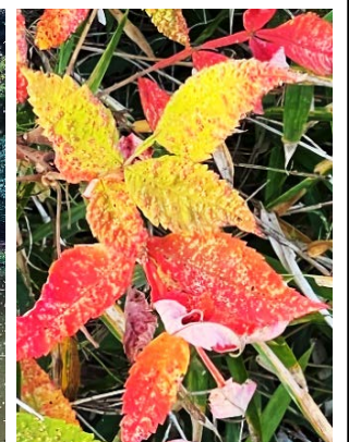
ヌルデの葉も赤く