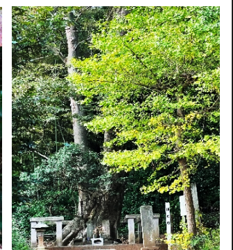
銀杏も黄色く頼政塚に