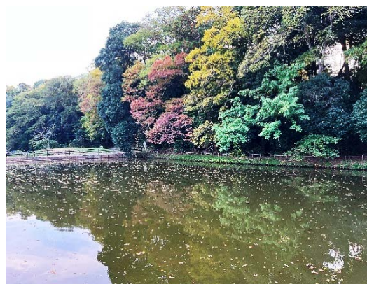
水神池の木々も色を変えはじめて