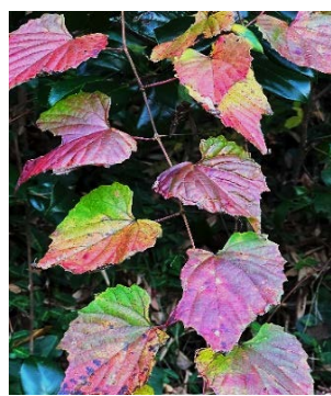
緑から赤くツタモミジ