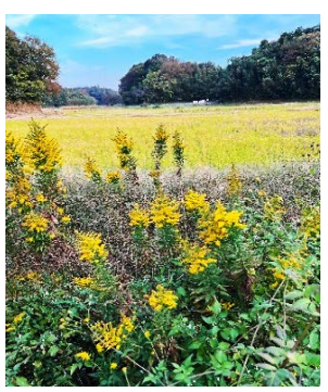
稲刈り後の谷津田