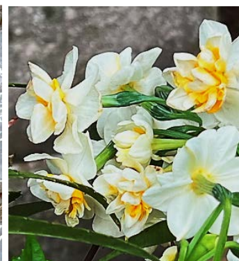
頼朝塚のスイセン