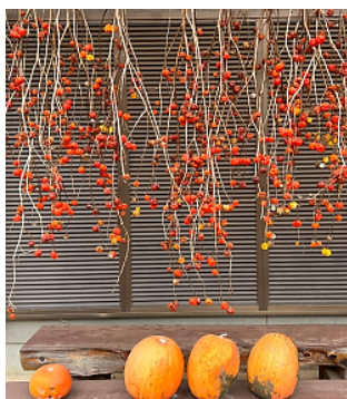
赤い物が目に染みる