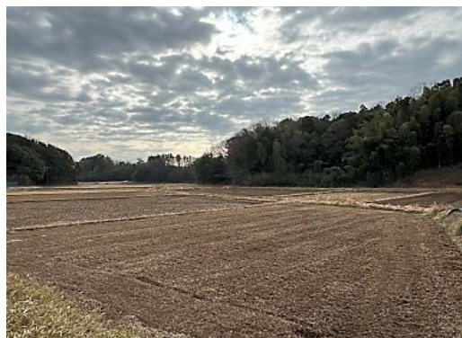
冬の谷津田は少し寂しい