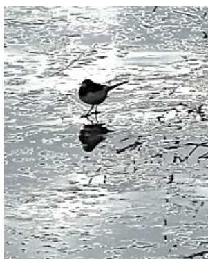
水氷の上のセキレイ