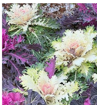
葉牡丹がバラのよう