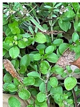
ハコベが萌えている