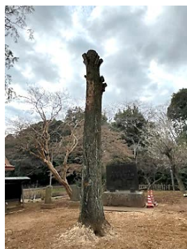
銀杏の枝木が剪定されている

住宅が増えたせいか、結縁寺を訪れる人を多く見かける。 時代の移り変わりを感じる。早くウグイスの声を聞きた～い。